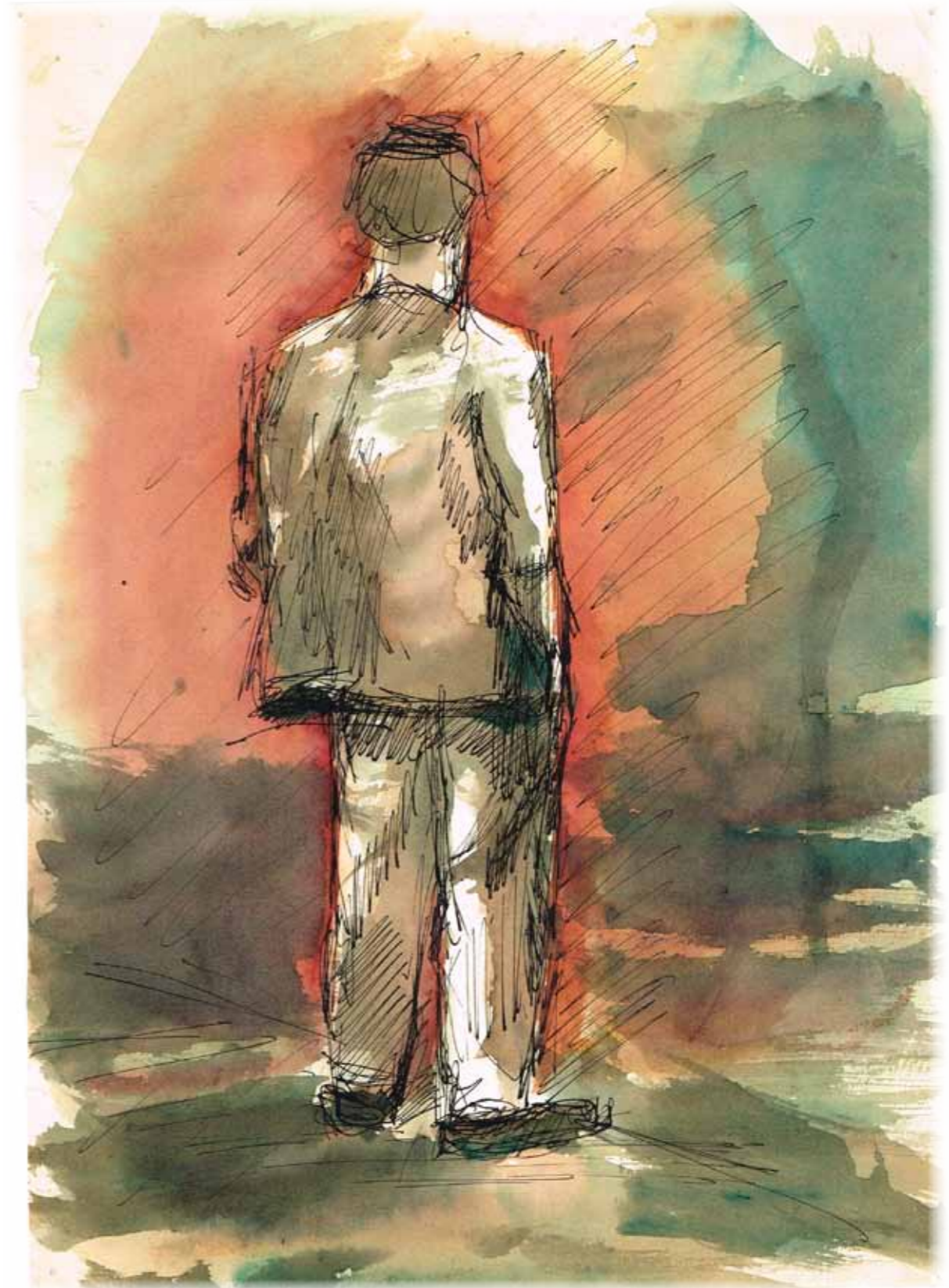
Vécsei Miklós / A töprengő (1960)